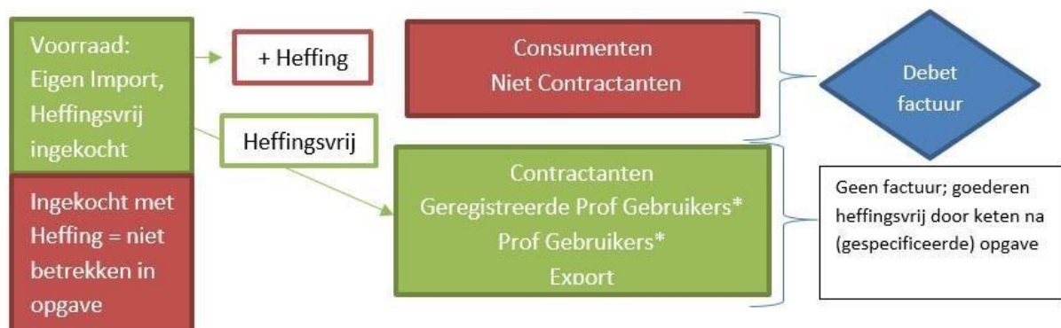
Stroomschema opgave Contractanten.

CNT geven maandelijks op de thuisKopieportal per productgroep op hoeveel zij hebben verkocht . Zij splitsen hun totale verkopen uit naar; contractanten, professionele gebruikers en export. Let op: indien voorwerpen zijn ingekocht met heffing hoeven deze NIET te worden opgegeven, er kan voor deze voorwerpen wel restitutie worden aangevraagd, lees verder onder Restitutie. Ook gelden er aparte afspraken voor heffingsvrij leveren tussen contractanten; alleen na onderlinge afstemming!