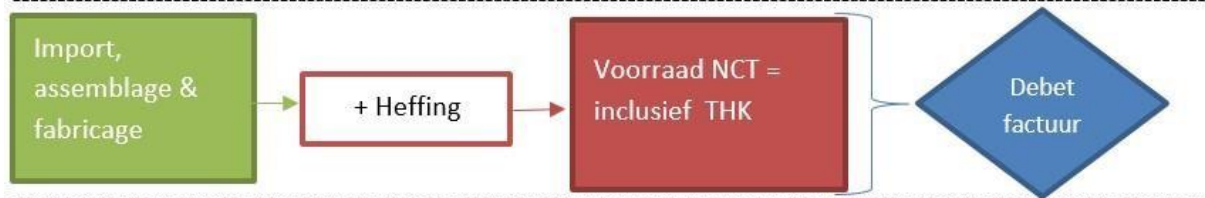
Stroomschema opgave Niet-Contractanten

NCT geven op de ThuisKopieportal per productgroep de aantallen op van importen of fabricages. Ook leveren NCT de bewijzen aan van de importen/fabricages in een verplichte bijlage bij hun opgave.